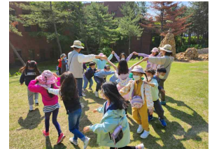
(2학년) 소래산 생태교육