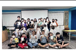
(6학년) 즐거운 독후활동