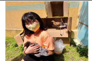
생명감수성 동물보호소 만들기 활동