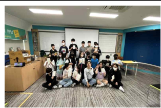
(6학년) 작가와의 만남