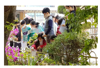
(4학년) 강낭콩 관찰하기