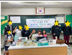
대흥중, 대야초 환경동아리 - EM공 만들기, 고구마 심기