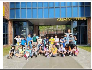
(2학년) 시흥 창의 체험 -맑은 물 상상 더하기