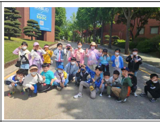
(2학년) 소래산 생태교육