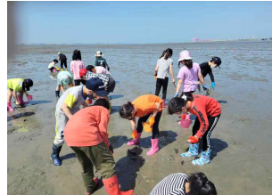
(3학년) 오이도 갯벌체험