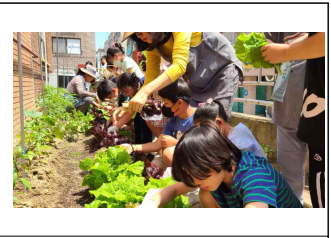
(3학년) 텃밭상추 수확