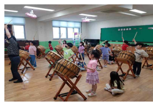
1학년 난타 동아리 활동