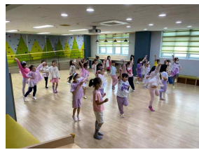
1학년 댄스 동아리