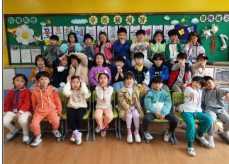
(1학년) 설레임 속에서 힘차게 시작하는 우리들 ~