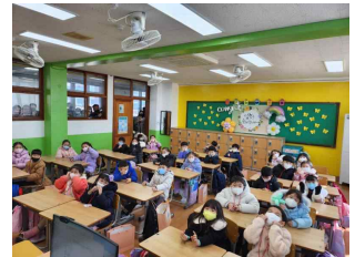
(1학년) 설레는 첫 만남 ♥