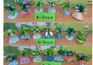
(5학년) 미술<봄이 왔어요>