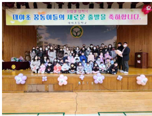
(1학년) 2023 입학식 풍경