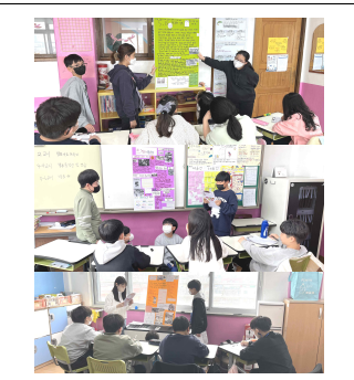
(6학년) 민주화운동 연구발표