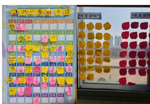
(3학년) 3월 고.구.마 아이들의 희망과 다짐