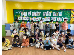
(1학년) 함께 하는 우리들 ♥