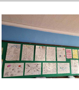
(6학년) 스스로 학급운영계획세우기