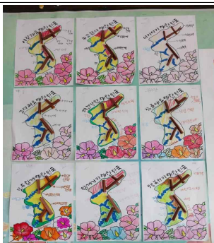
(5학년) 우리나라 지형도