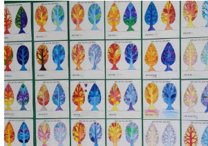
(3학년) 따뜻한느낌과 차가운 느낌 나타내기