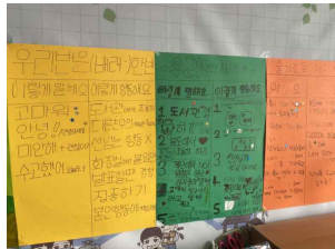
(5학년) 학급 가이드라인 만들기