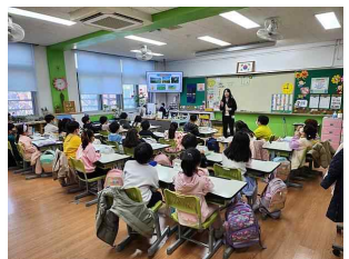
(2학년) 시흥의 사계