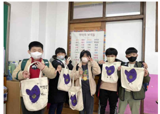
(4학년) 고구마반 에코백 만들기