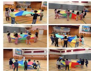
(2학년) 우리꿈을 띄워요